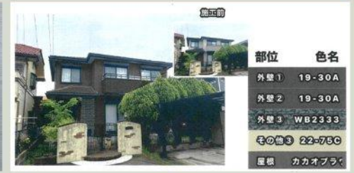
カラーシミュレーション